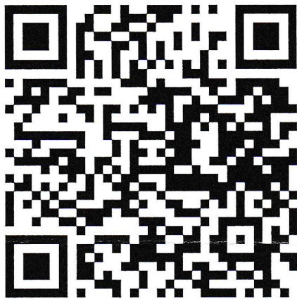
แผนพับประชาสัมพันธ์ กองทุนยุติธรรม